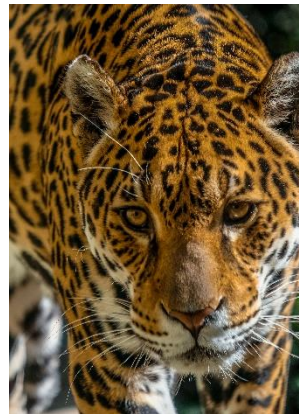
Dit portret van een panter is direct en confronterend. Niet echt in zijn natuurlijke omgeving, maar wel mooi gedaan.