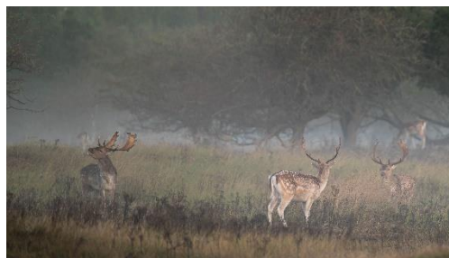
Het burlend hert maakt samen met de andere herten een mooie sfeer.