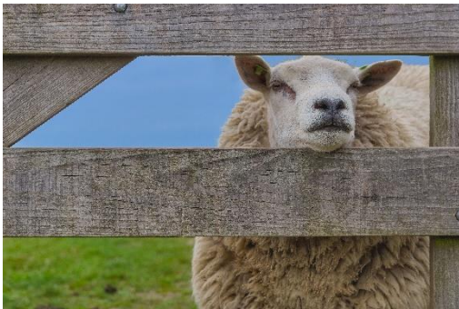
De foto van het schaap achter een hek is mooi rustig gehouden. Fijne compositie.